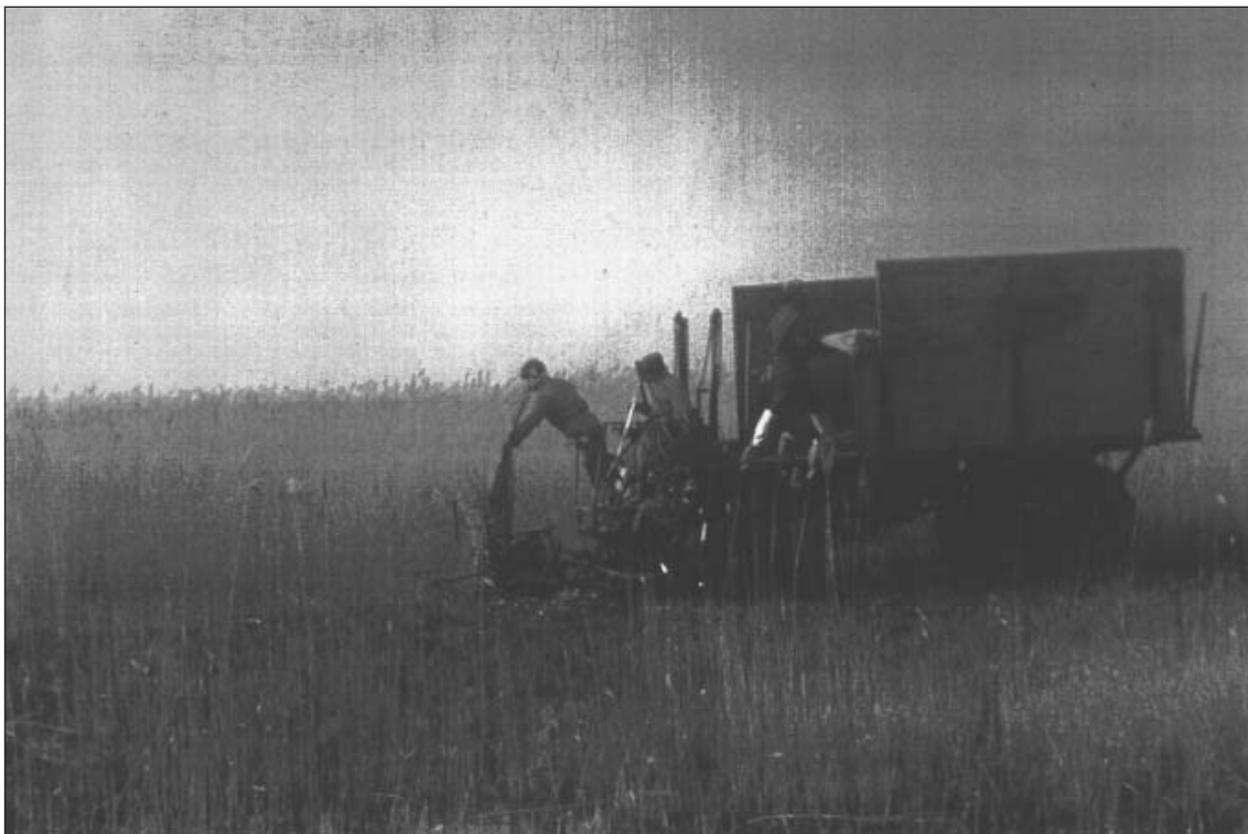
J. Davy/syndicat mixte

puis ses conclusions, doivent recueillir l'approbation à la fois du CIME et du CSE. Pour encourager le recours à la nouvelle procédure d'évaluation, le décret charge le Commissariat général du Plan du développement de l'évaluation des politiques publiques et crée un fond destiné à financer les projets d'évaluation. En 1990, le Commissariat au Plan diffuse donc auprès des ministères une circulaire qui les encourage à présenter des projets d'évaluation. C'est cette opportunité qui sera activement mise à profit par le ministère de l'Environnement. Pour le comprendre, il faut revenir un peu en arrière.